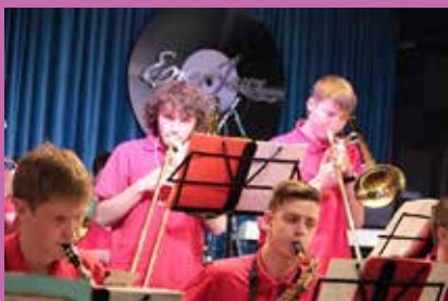
Debut Jazz Band

Нестандартный джазовый фестиваль состоялся в Екатеринбурге. Выступить на нем смогли коллективы, равноправными участниками которых являются профессиональные музыканты с инвалидностью и без. Именно поэтому фестиваль получил название «Inclusive Jazz». Помимо развлекательной части, эта тусовка преследовала и благородные цели. Все средства, вырученные с концерта, передали организации «Благое дело», помогающей людям с ментальными нарушениями. К слову, собрали неплохо – свыше 20 тысяч рублей передали благодарные музыкантам зрители.