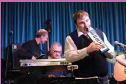
Waves Band

Сменили их ребята из «Waves band» - музыкального коллектива, созданного при «Благом деле». Постепенно у команды сформировался репертуар из джаза, блюза, рока и собственных композиций.